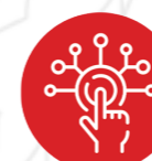
Plateforme de dématérialisation Contrats, relevés d'heures, fiches de paies...