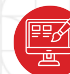
TempoMarket Plateforme de personnalisation de supports marketing