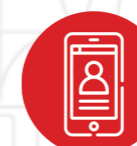
Temporis Prospection Application commerciale de géolocalisation clients