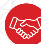
E-service Interface de création de propositions commerciales (signatures électroniques...)