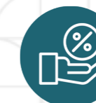
CET (Compte Épargne Temps)