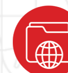
Temporis Connect Site de recrutement dédié aux clients entreprises