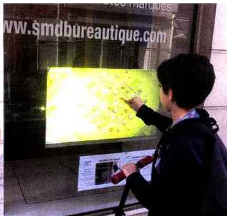
» Projetée contre le verre de la vitrine, la tablette tactile et connectée de SMD Bureautique fonctionne sous Android.