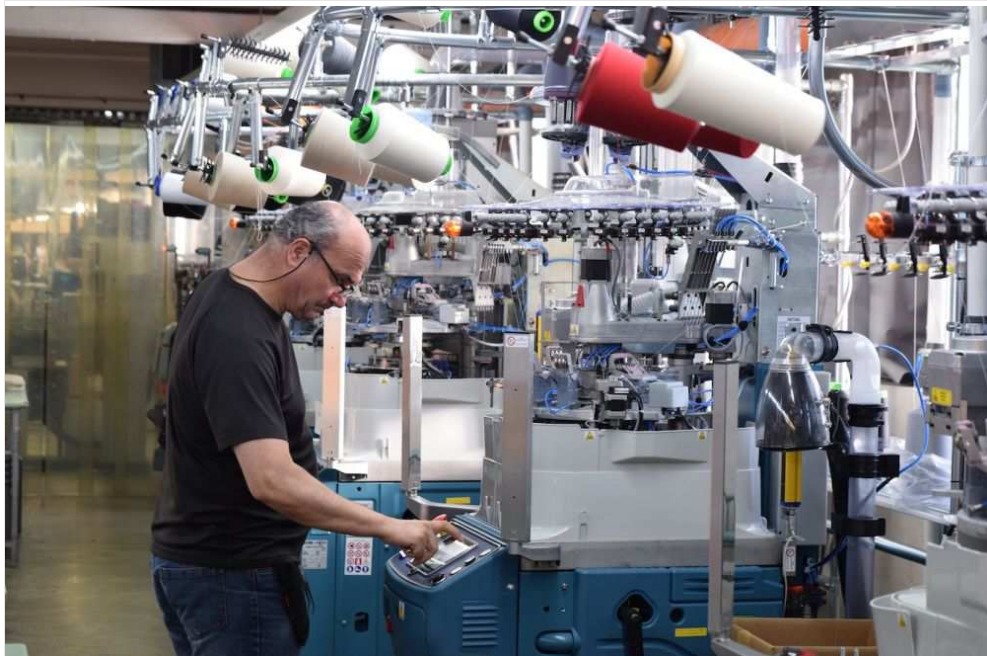
Réglage d'une des nombreuses machines à tricoter.